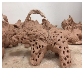
marsmannetje in klei

Groep 3 werkt aan het thema ruimte en denkt na over wonen op planeet Mars.