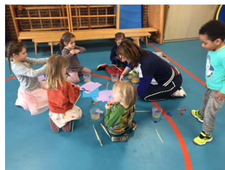
(Trommels maken in de groepen 1-2)

https://photos.app.goo.gl/6xFbtaNf3W82w3D2