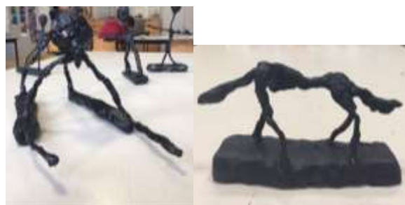
Beelden door groep 7/8

De leerlingen van groep 7 en 8 hebben de afgelopen weken gewerkt aan kunstwerk in ijzerdraad en was, geïnspireerd op het werk van Giacometti.