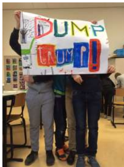
Typografische poster van groep 6

De leerlingen van groep 6 hebben de afgelopen weken gewerkt aan het thema: Dit wil ik zeggen!