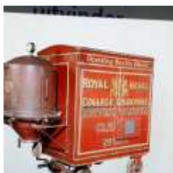
Zo was het...