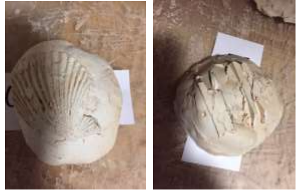
Fossielen maken in groep 4

De leerlingen van groep 3 maken een handpop van een sok en leen zo met naald en draad te werken.