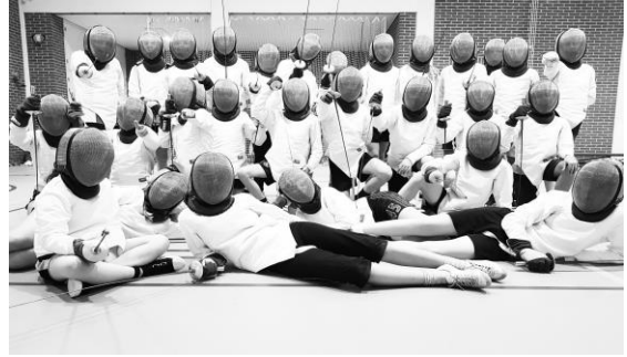
Groep 8a: "Even lachen naar de camera....."

Deze week wordt er tijdens de gymlessen geschermd.