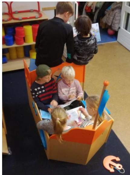
tutores aan het werk in de onderbouw

Maandagmiddag 4 december zijn de klassen opgevulld met supermooie surprises, die we dinsdag gaan uitpakken. Wij wensen jullie alvast een leuk sinterklaasfeest.