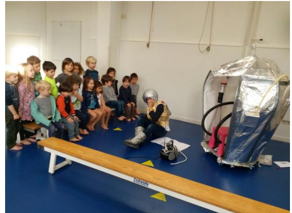
Ofu is in de speelzaal geland

Ook hebben de kinderen Ofu ontmoet, een ruimtewezen dat per ongeluk bij ons in het speellokaal was beland. Hij kwam per ruimteschip en had wat moeite met onze taal. Maar de kinderen konden hem goed helpen en hebben hem afgelopen week weer uitgezwaaid.