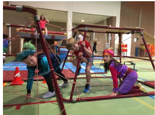
Pietengym van groepen 5 en 6

Op 1 december is het weer tijd voor een open podium met als thema Sinterklaas. De groepen van Femke en Gerda trappen deze keer af. De kinderen zijn erg enthousiast en al erg druk met het oefenen van hun optredens!