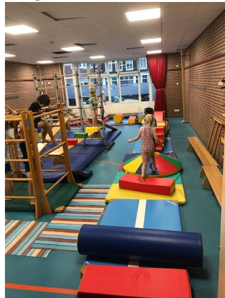
Lopen op een maanlandschap