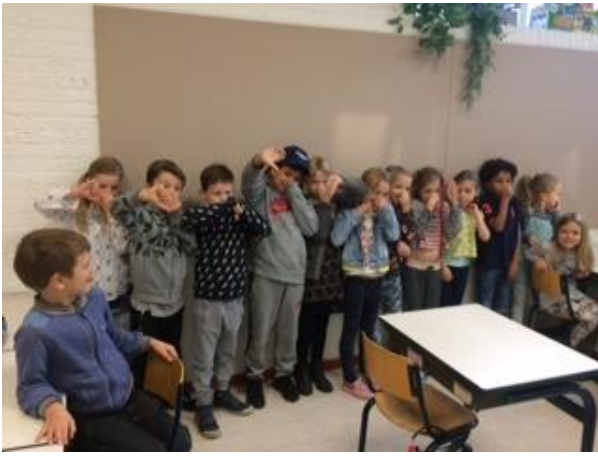
Groep 4c ruikt het bord

Alle lokalen op de Westerstraat hebben zo'n mooi prikbord gekregen.